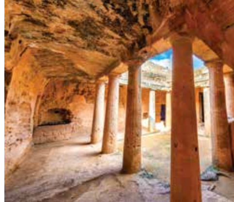
左から:コーラル・ビーチ、オデオン、王族の墓