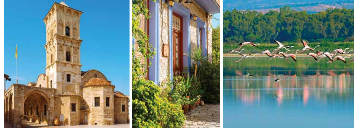
左から:聖ラザロス教会、レフカラ村、塩湖

ラルナカからレメソスに向かう途中にある美しい村レフカラ。そこでは、500年前に村を訪れたレオナルド・ダ・ビンチのように、伝統手芸レフカラレースの美しさに魅了されること間違いなしです。