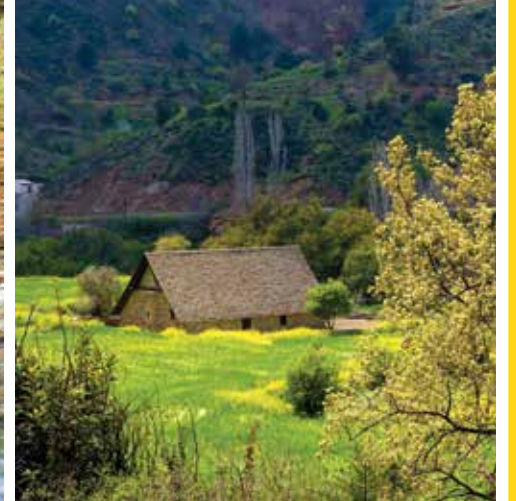
左から:トロードス山域、カコペトリア村、ガラタ村