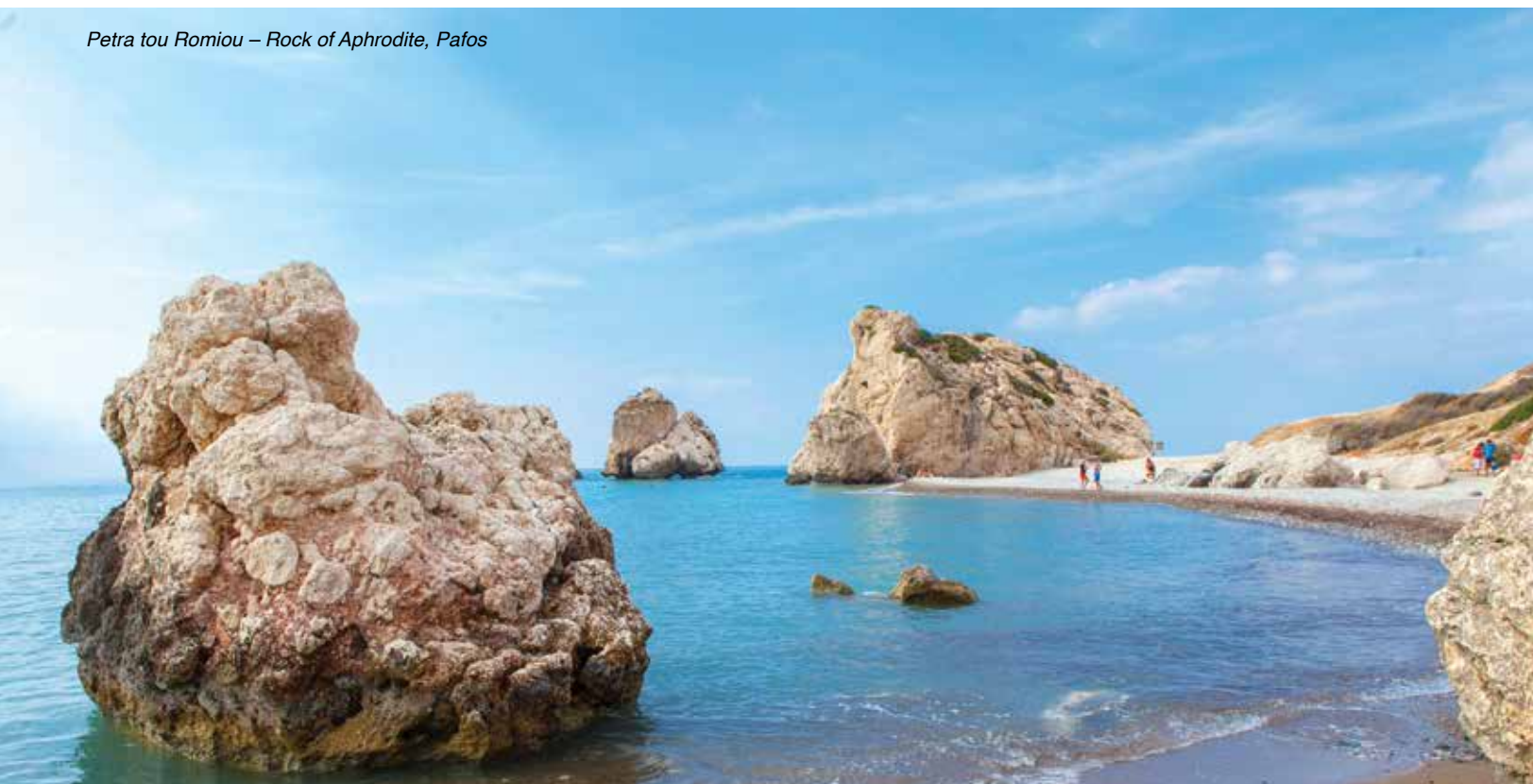
Petra tou Romiou – Rock of Aphrodite, Pafos

このような長い歴史を持つ島を単に歩いて回るだけでも素晴らしい思い出になり、歴史的な体験を深めることにもなります。首都レフコシア(ニコシア)ではヴェネチア共和国が支配する時代に建てられ現在も街を取り囲んでいる圧倒的な城壁を形作る石に触ることができます。パフォスには聖パウロの柱や、それより古い時代のモザイクの素晴らしいエイオンやディオニソスの館、その他にも過去の美しい遺跡が多数存在しており、この古代都市全体がユネスコの世界遺産に指定されています。クーリオンにあるギリシャ・ローマ建築の劇場や、その近くのアポロン神殿、ペトラ・トゥ・ロミウ(アフロディーテの岩)なども見逃せません。