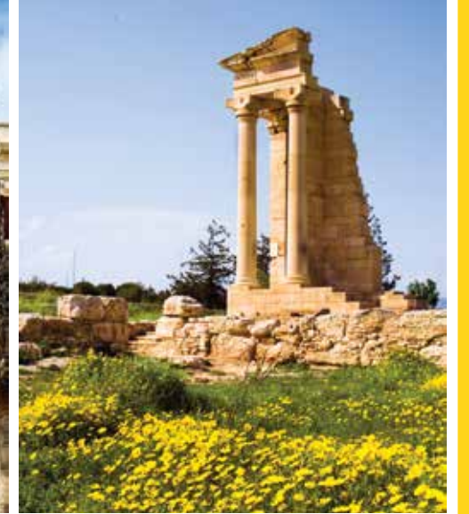
左から:コロッシ城、市立図書館、アポロン神殿