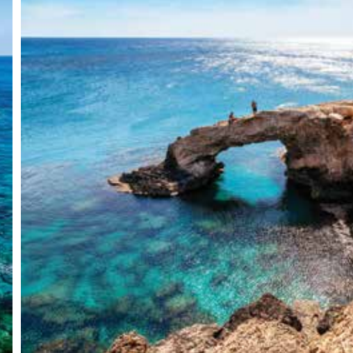
左から:コノス・ビーチ、海食洞、ケープグレコ