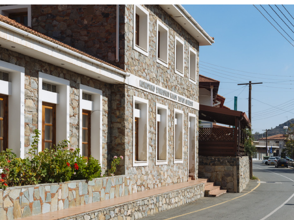
Деревня Кало Хорио. Лимассол.

Проезжайте через деревню и дальше прямо по указателям, поверните направо. Ориентиром может служить приметное ореховое дерево. Так вы попадёте в деревню Агиос Павлос, известную своими садами. А если вы повернёте налево, то тогда доберётесь до Кало Хорио.