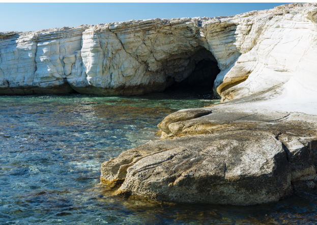
Побережье Агиос Георгиос Аламанос

Далее, маршрут предлагает вам двигаться по оживленной дороге, внутрь страны и, следуя указателям, повернуть на юг, к монастырю Агиос