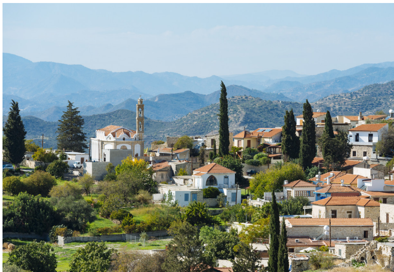
Като Дрис (нижний Дрис).

В Мелини, поверните налево и направляйтесь к горной деревне Эптагонии, примерно в 25 километрах к северо-востоку от Лимассола. Эптагония особенно известна своими восхитительными мандаринами. Здесь вы найдёте великолепную церковь Агия Марины, которая стоит в центре деревни. Построенная из чёрного камня в начале 19 века, церковь хорошо сохранилась, а ее внешняя стена имеет ширину 1 метр.