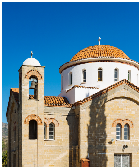
Агия Марина Эптагония.

Эптагония, примерно в 25 километрах к северо-востоку от Лимассола. Она хорошо известна своими вкусными мандаринами.