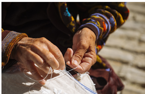
Плетение кружева. Лефкара.