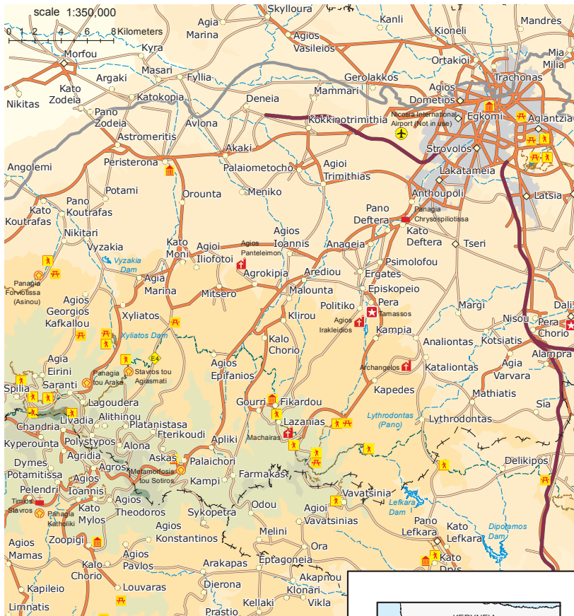
Prepared by Lands and Surveys Department, Ministry of Interior, Kypros 2015.

Никосия - Строволос - Като и Пано Дефтера - Псимолофу - Эпископио - Политико-Тамассос - Пера - Кампья - Капедес - Монастырь Махэрас - Лазаньяс - Гурри - Фикарду - Клиру - Малунта - Агрокипия - Митцера - Платанистаса - Фтерикуди - Аскас - Палэхори - Алона - Полистинос - Лагудера - Ксилиатос - Агия Марина - Агия Митсо - Орунта - Перистерона - Акаи - Коккинотримисья - Никосия