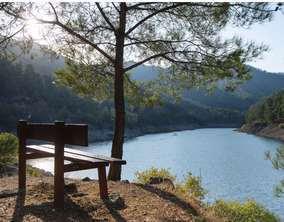
Плотина (водохранилище) Ксильятос.

Плотина Ксильятос является отправной точкой для пешеходной тропы вокруг водохранилища.