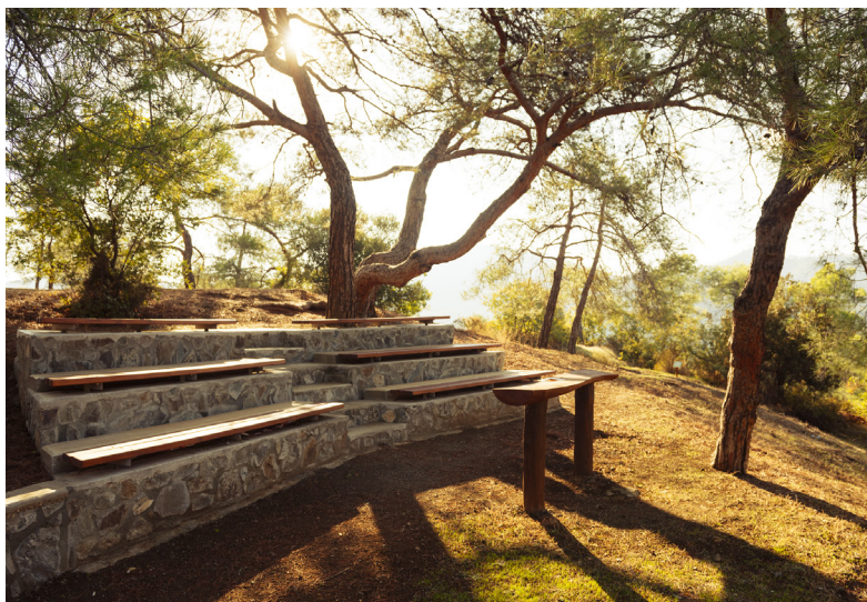
Мантра ту Кампию Капедес

Далее, следуйте на юг по главной дороге, чтобы добраться до кольцевой развязки Капедес, расположенной у подножия горы Махэрас, с правым поворотом, чтобы подняться в монастырь Махэрас. По пути в монастырь,