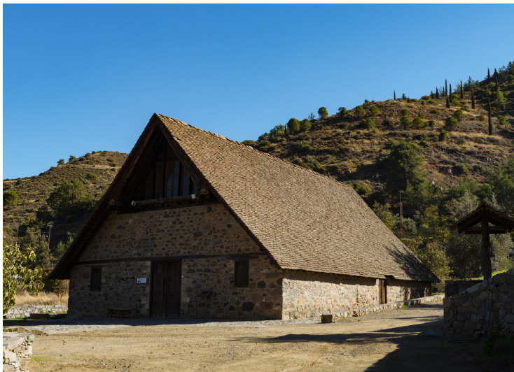
Panagia Podithou Galata

De là, revenez sur la route principale Lefkosia-Troodos, passez par Evrychou, où vous pouvez visiter l'ancienne station de chemin de fer et le musée, situé à l'ouest du village, puis tournez à droite vers Nikitari et la forêt afin de visiter Panagia Asinou, l'une des plus belles églises peintes de l'île, située dans une clairière de la forêt et qui abrite quelques-uns des plus beaux exemples de l'art byzantin du début du 12 e siècle. Egalement listée sur la liste du Patrimoine de l'Unesco à Chypre, son intérieur est entièrement décoré de peintures murales réalisées entre les 12 et 17 e siècles. La route du retour s'effectue par Kato Koutrafas, puis en franchissant le pont pour rejoindre la route principale, par Peristerona et Akaki jusqu'à Kokkinotrimithia, où l'on reprend l'autoroute pour Lefkosia.