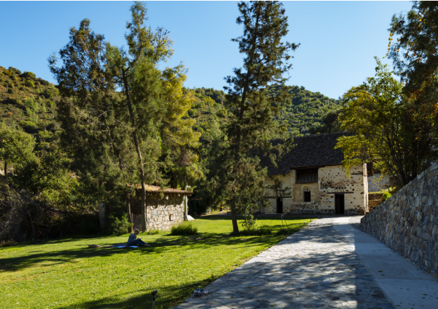
Agios Nikolaos tis Stegis

11 e siècle qui fut celle d'un monastère byzantin, classée au Patrimoine Mondial de l'Unesco. Elle doit son nom à son toit très en pente et abrite des fresques réalisées au cours d'une période de plus de 600 ans, dont les plus importantes peintures murales du 11 e siècle existant encore à Chypre.