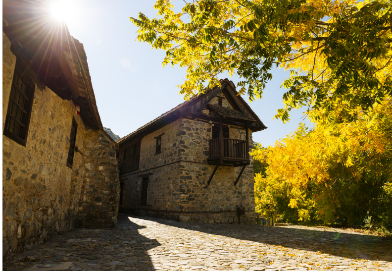
Agios Ioannis Lampadistis, Kalopanagiotis

dans la fertile vallée de Marathassa, dont le nom vient de celui d'une espèce de fenouil et qui est réputé pour ses fruits, notamment ses cerises. Kalopanagiotis est aussi l'une des villégiatures de montagne les plus réputées de Chypre et mérite également une visite, non seulement pour le complexe religieux du monastère d'Agios Ioannis Lampadistis, mais aussi pour ses rues étroites pavées que bordent ses maisons aux toits de tuiles et balcons fleuris, dont