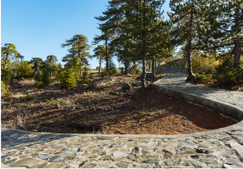
Botanical Garden Troodos

A partir de là, la montée est plus raide et la route serpente dans la forêt, offrant de magnifiques points de vue panoramiques sur la baie de Morphou, jusqu'à Prodromos, le plus haut village de Chypre, à 1380 mètres, puis jusqu'à Troodos Square