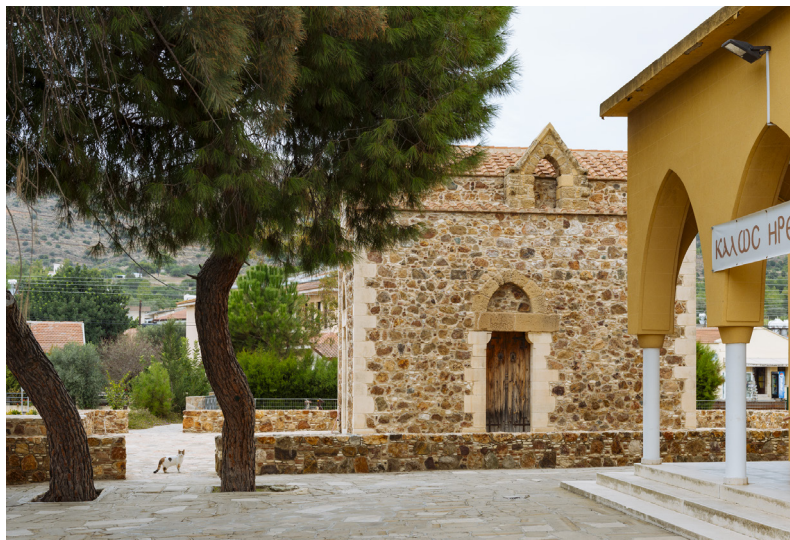
Chapelle royale de Pyrga

Au bout de la route, tournez à gauche vers le sud en direction de Lympia, puis Dali, afin de visiter le site et le musée local de l'antique Idalion, un ancien royaume fondé, pense-t-on, vers 1220 av. J.C. La ville comprenait trois quartiers, les acropoles est et ouest, entre lesquels s'étendait la ville