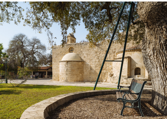
Kiti Panagia Angeloktisti

Poursuivez l'itinéraire sur la route côtière principale, puis prenez à gauche vers Alaminos afin de visiter la Tour d'Alaminos, sur votre droite. Située à côté d'un champ, avec une belle vue sur la mer, cette construction en pierre de forme oblongue servait autrefois de tour de guet. Prenez ensuite la première à droite afin de rejoindre la route côtière principale.