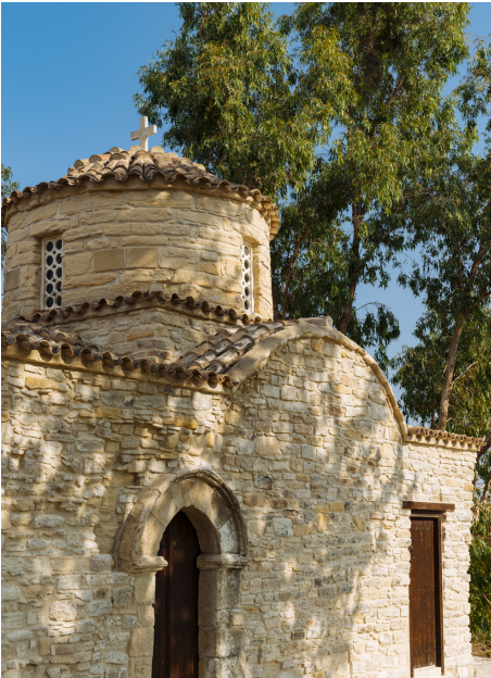
Agios Mamas Alaminos

peut le constater en prenant la route du sud jusqu'à la côte.