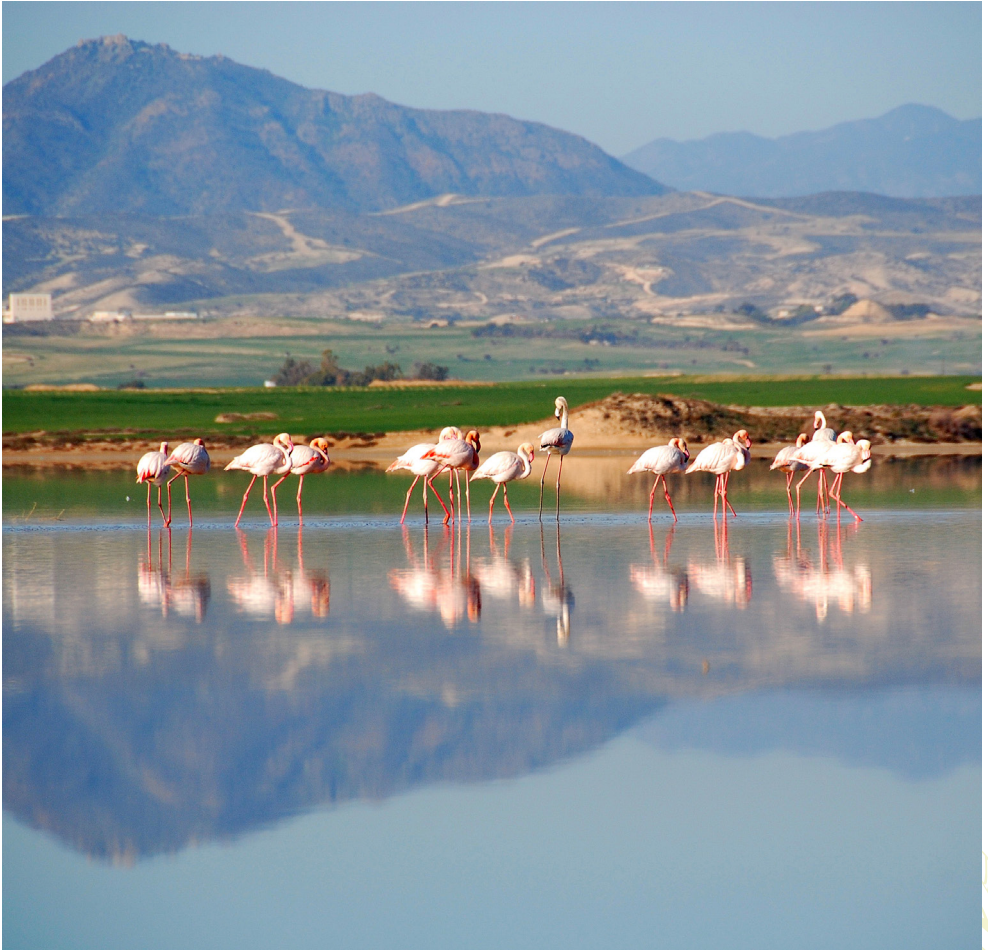
Lac salé de Larnaka

Entourée de grands et magnifiques palmiers sur les bords ouest du lac salé de Larnaka, la mosquée, construite en 1816, est l'un des plus importants lieux de pèlerinage du monde musulman