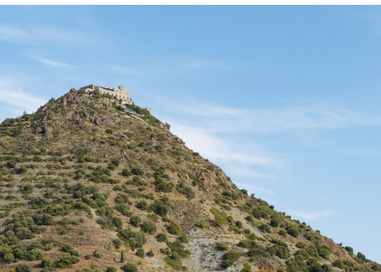
Monastère de Stavrovouni

Tournez maintenant à droite en direction de Kornos, un village réputé pour la qualité de sa production de miel et son artisanat de poteries d'argile. La coopérative villageoise de la Compagnie des Potiers utilise l'argile rouge que l'on trouve en bas de la montagne de Stavrovouni pour fabriquer un large éventail d'artefacts, comme des pots, des jarres à vin, des pichets, des ruches en glaise, des urnes, etc. Depuis Kornos, prendre la route au sud du village qui traverse la forêt de Kornos, un lieu idéal pour se reposer sur l'aire de pique nique aménagée au milieu des cyprès, des pins, des oliviers, des eucalyptus, des térébinthes et des lentisques.