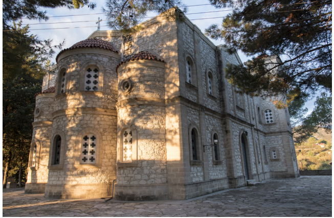
Kirche zu Agios Ioannis Theologos, Pera Pedi

In den Weindörfern am Westufer des Kryos Flusses finden Sie zahlreiche traditionelle Werkstätten, in denen typisch zypriotische Süßspeisen und hervorragende Weine hergestellt werden. Gerne können Sie dort bei der Herstellung von Leckereien wie Soutzoukos, Kiofteri, Palouzes, Daktyla und vielen weiteren süßen Delikatessen zusehen.