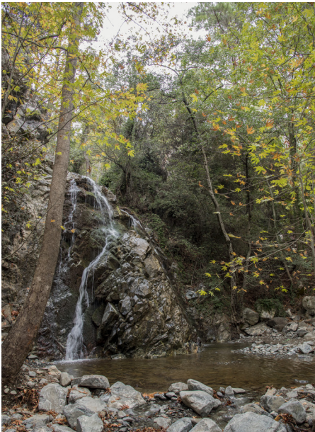
Hantara Wasserfälle bei Foini

Wenn Sie beim Verlassen von Troodos der Straße in Richtung