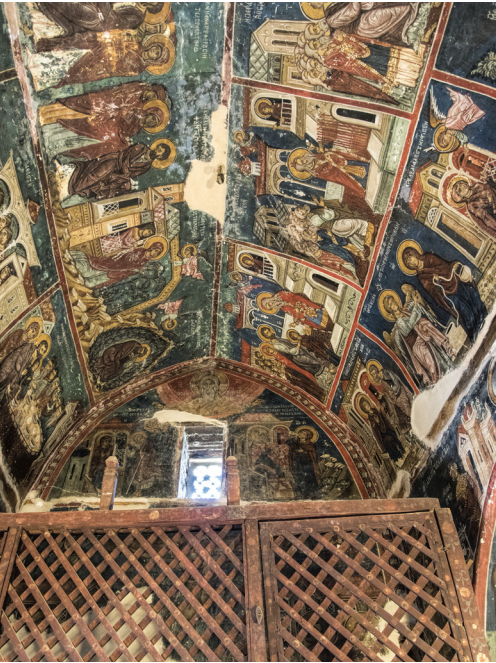
Timios Stavros, Pelendri

Fahren Sie vom Kreisverkehr in Polemidia auf der B8 in Richtung Norden nach Troodos und nehmen Sie die rechte Ausfahrt nach Apesia und dann weiter nach Korfi, einer Siedlung die in den 1970-er Jahren angelegt wurde, um den Dorfbewohnern ein neues Zuhause zu geben, nachdem der ursprüngliche Ort infolge mehrerer Erdbeben unsicher geworden waren.