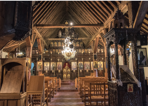
Agia Marina Kyperounta

Biegen Sie vor dem Dorfplatz von Agros links ab und folgen Sie den Wegweisern nach Karvounas/Troodos, um nach Chandria und weiter nach Kyperounta zu gelangen. Auf der Fahrt können Sie den wunderschönen Blick auf Agros genießen.