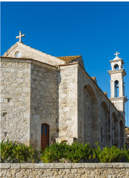
Kirche zum Erzengel Michael in Mitsero