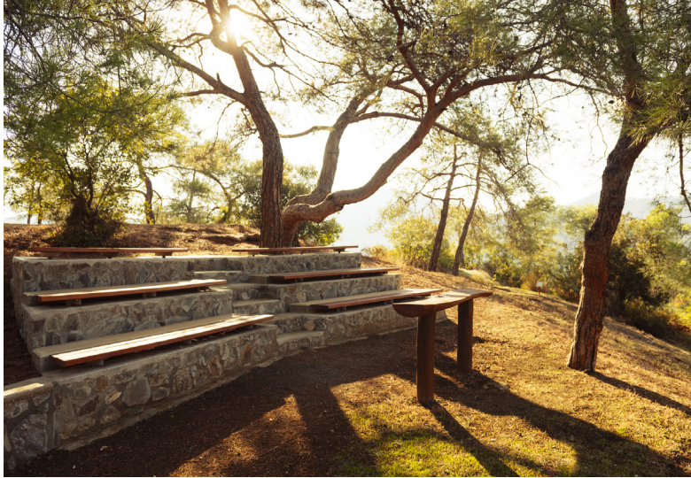
Mandra tou Kapiou Kapedes

Fahren Sie südöstlich durch das Dorf auf einer schmalen, nicht asphaltierten Landstraße nach Pera und dann weiter nach Süden bis zum Ort Kampia östlich des Tamasos Damms. Wenn Sie Lust auf ein kleines Abenteuer im Freien haben, empfehlen wir einen Besuch bei den Ruinen der alten Siedlung im unteren Teil des Tals, westlich des Ortes, wo Sie die unberührte landschaftliche Schönheit der Gegend genießen können.