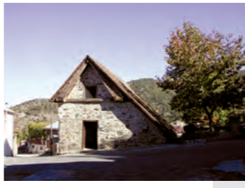
Ναός Αρχαγγέλου Μιχαήλ, Πεδουλάς.