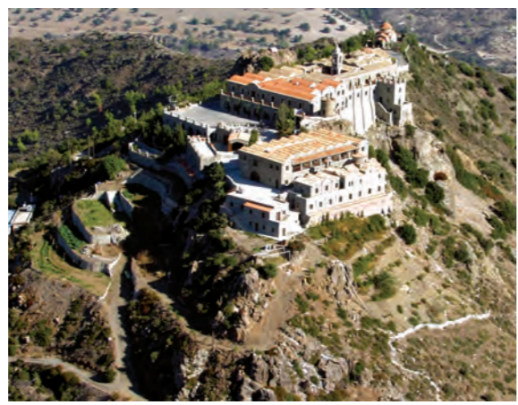
Μονή Σταυροβουνίου «Αι ανθούσαι Μοναί επί του απόκρημνον ορέων της Νήσου».