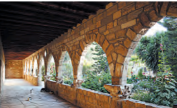
Μονή Αγίου Νικολάου, των Γάτων, Ακρωτήρι.