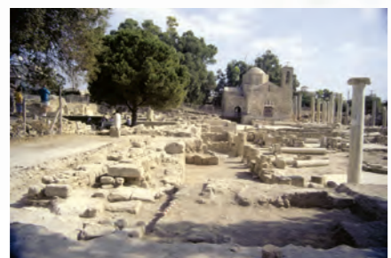
Πεντάκλιτη Βασιλική Παναγία Χροσπολίτισσα, Κάτω Πάφος. Βήμα απ' όπου κήρυξαν το Ευαγγέλιο, οι Απόστολοι Παύλος και Βαρνάβα (45 μ.Χ.)