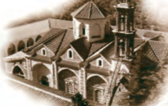
Μονή Απ. Ανδρέα