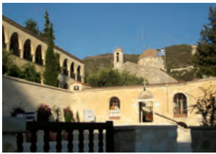
Μονή Αγίου Νεοφύτου, Τάλα.