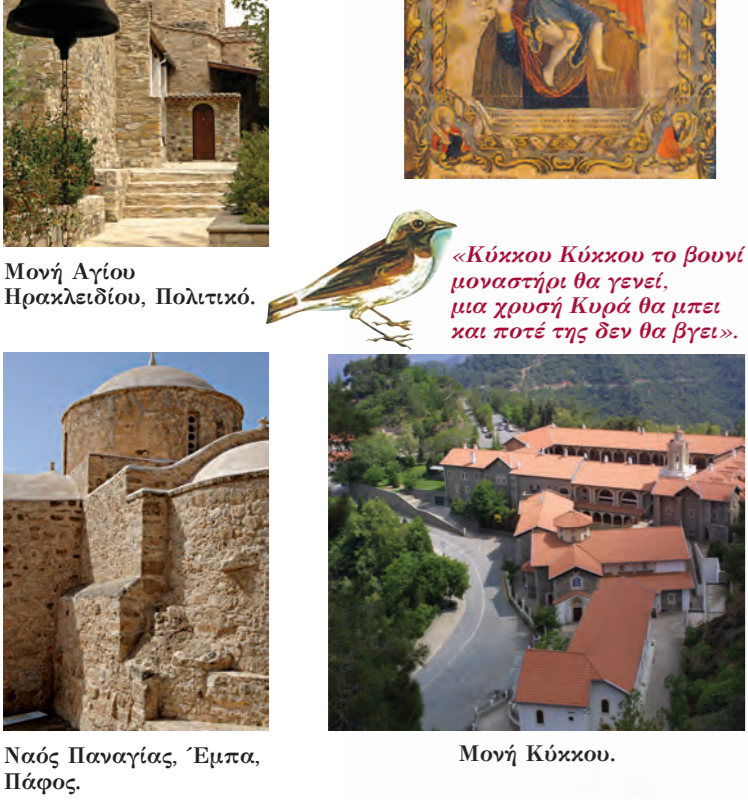
«Κύκκου Κύκκου το βουνί μοναστήρι θα γενεί, μια χρυσή Κυρά θα μπει και ποτέ της δεν θα βγει».