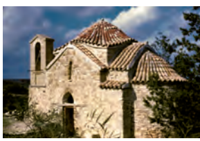
Ναός Αγίου Αποστόλου, Πέρα Χωριό.