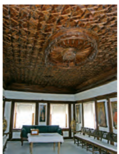
Μονή Τιμίου Σταυρού Ομόδου.