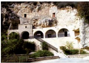
Εγκλιεστρα Αγίου Νεοφύτου, Τάλα.