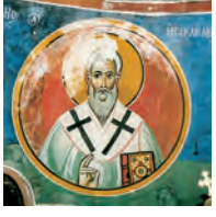
Άγιος Ηρακλείδης από το Ναό της Παναγίας του Άρακα, Λαγυδιέρα.