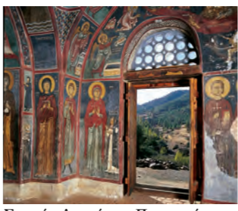
Σηπρές Δευτέρας Παρουσίας, Άγιος και Λοιπές, άποψη του Νάρθηκα, εκκλησία Παναγίας της Ασίτου.