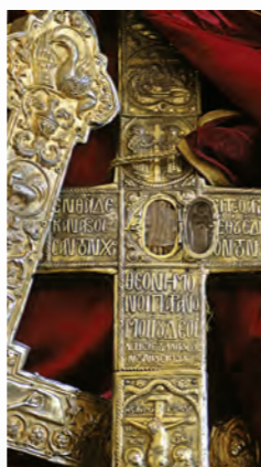
Λιτανεία, Μονή Μαχαίρας.