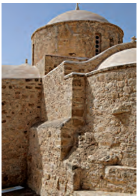
Ναός Παναγίας, Έμπα, Πάφος.