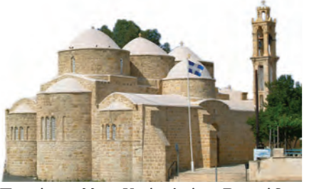
Πεντάτρολλος Ναός Αγίου Βαρνάβα και Παύλου, Περιστέρωνα.