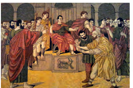
Ο εκρισταγιασμός του πρώτου Ρωμαίου Διοκλήτη της Πάφου, Ανθύπατου Σέργιου Παύλου, από τους Αποστόλους Παύλο και Βαρνάβα (45 μ.Χ.)