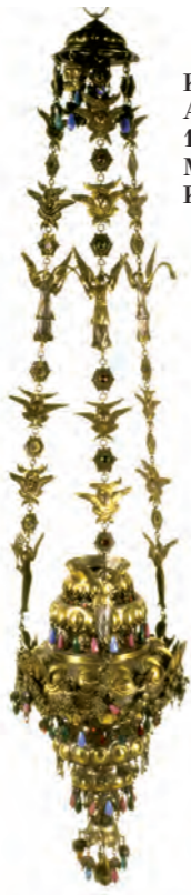
Καντήλα Αργυροπύργου, 19ος αιώνας, Μουσείο Κύκκου