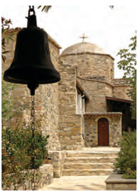
Μονή Αγίου Ηρακλείδου, Πολίτικο.