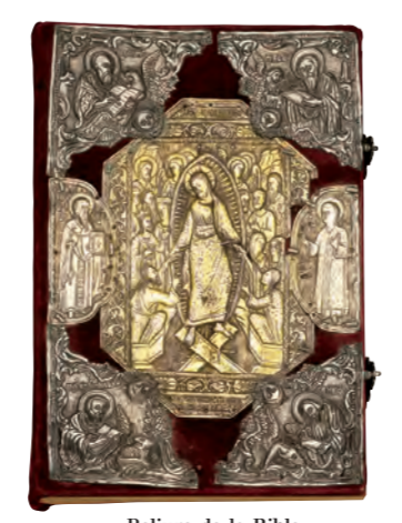
Reliure de la Bible, 1775 et 19e siècle, 35,5x24,5x3,5 cm, d'argent. Monastère d'Agios Ioannis Lampadistis, Kalopanagiotis.